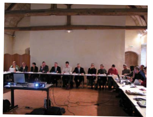
Session plénière de CLE, le 15 octobre 2010 à Vivoin

C'est collectivement que les acteurs du bassin ont fixé à travers le SAGE les objectifs à atteindre et les mesures opérationnelles et réglementaires qui permettront de les atteindre.